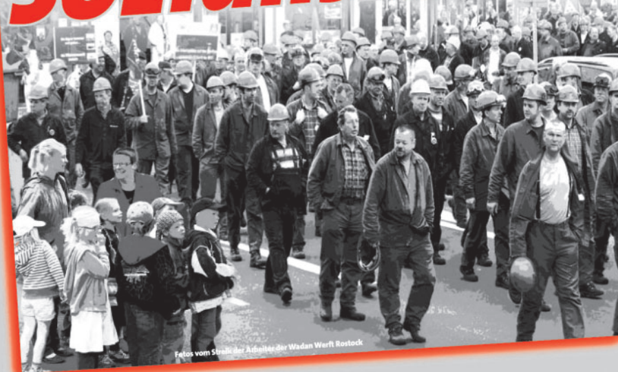
Fotos vom Streik der Arbeiter der Wadan Werft Rostock