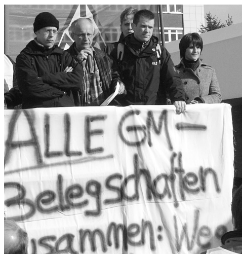
7-Tage-Streik, Torblockade und Werksbesetzung bei Opel/Bochum 2004 setzen ein Zeichen für die Arbeiteroffensive

Dafür tritt die MLPD seit 1974 ein! Was in anderen europäischen Ländern selbstverständlich und zum