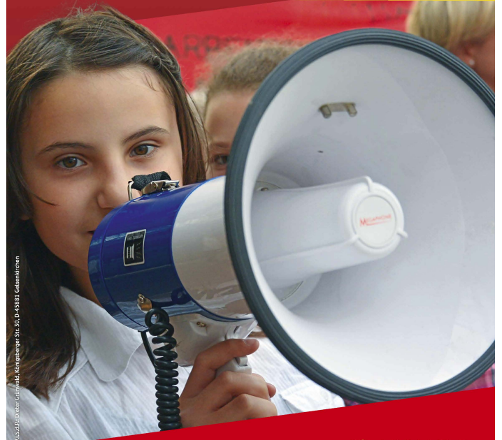
MLPD/Dieter Göttschke, Königberger Str. 30-D-49381, Gelsenkirchen