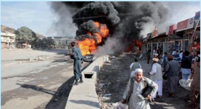
Afghanistan: „sicheres Herkunftsland“?