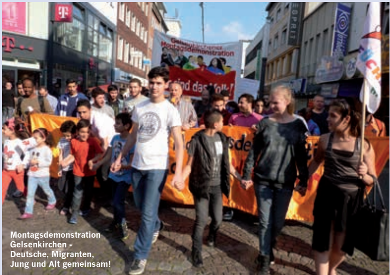
Montagsdemonstration Gelsenkirchen - Deutsche, Migranten, Jung und Alt gemeinsam!