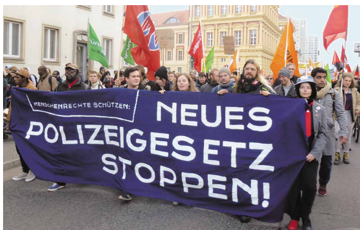
Tatsächlich unteilbar und gleichberechtigt – das Brandenburger Bündnis #noPolBbg bei der Demonstration in Potsdam am 11. November

6. Prompt werden Anfang November 2018 in einem reaktionären Rundumschlag MLPD, Rebell, Inter- nationalistisches Bündnis, Montagsdemo, Umwelt- gewerkschaft und Frauenverband Courage aus dem #unteilbar-Bündnis ausgeschlossen. Dies von einer winzigen Minderheit der Demo-Unterstützer*innen und Aktivist*innen: 28 Leute von 70 Anwesenden besie- geln für 152 bundesweite Organisationen, 105 lokale