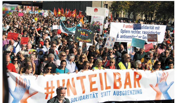
#unteilbar, 13. Oktober in Berlin: Fast eine Viertel Million gegen die Rechtsentwicklung der Regierung – und die Bandbreite von Religion bis MLPD

5. Insbesondere die Breite „von Religion bis Revolution“ bringt die Reaktion in Wallung. Seien es die AfD-Chefs Jörg Meuthen oder Björn Höcke, die FDP, der Bund deutscher Kriminalbeamter oder die Bild -Zeitung