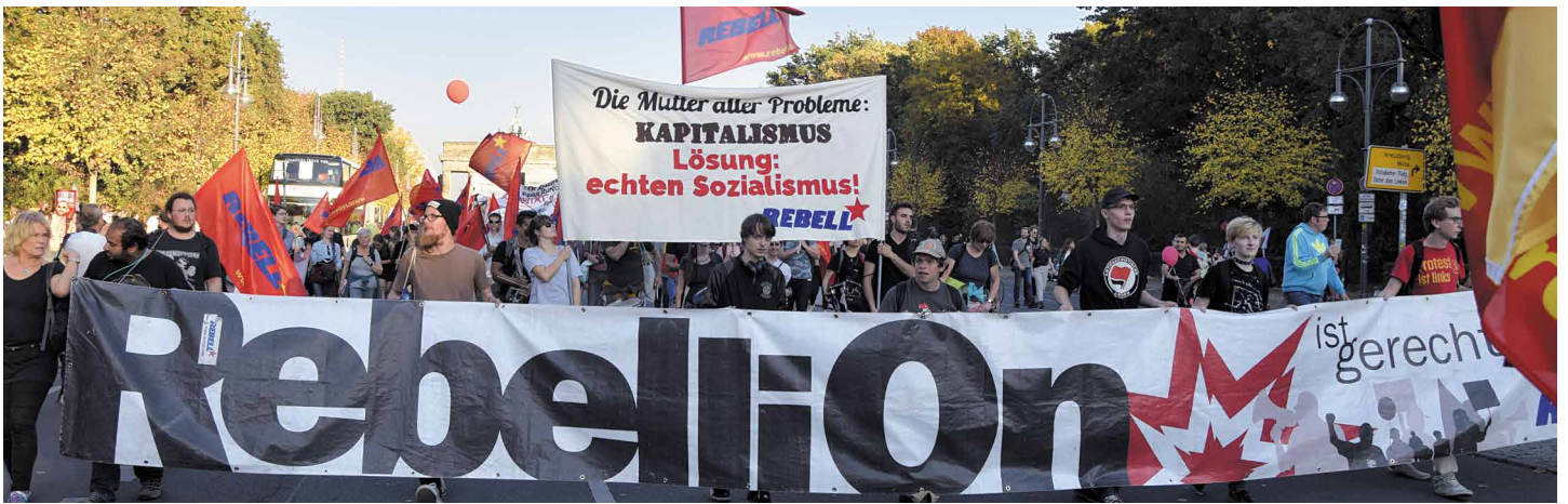
Mit ihrem Jugendverband REBELL organisiert die MLPD die Rebellion der Jugend – und nimmt die Mutter aller Probleme ins Visier

– unisono erheben sie die Forderung nach antikommu- nistischer Ausgrenzung. Am Tag nach der Demonstra- tion #unteilbar gibt Bild die Losung aus „Teilt euch!“ aus, als Auftakt einer dann folgenden Artikelserie, und sie fordert den Ausschluss angeblicher „Extremisten“ und „Antisemiten“. Wer konsequent die Rechtsentwick- lung der Bundesregierung bekämpft, wird zum Extre- misten erklärt. Wer – mit vielen Israelis gemeinsam – die faschistoide Politik der Netanjahu-Regierung kriti- siert, wird als „antisemitisch“ diffamiert. Absurde Anschuldigungen werden ins Feld geführt: Verwerflich ist schon das von der demokratischen Bewegung hart erkämpfte Recht, Flaggen und Symbole zu zeigen, wahrzunehmen oder Kundgebungen und Informations- stände durchzuführen. Sollen hier Zustände wie in Ungarn oder Polen eingeführt werden, wo kommunisti- sche Flaggen und Symbole verboten sind und rigoros unterdrückt werden?