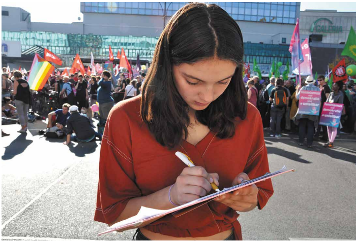
Viele zeigten ihre Flaggen – und viele folgten dem Aufruf zur organisierten Zusammenarbeit und trugen sich in die Liste des Internationalistischen Bündnisses ein

schluss von Marxisten-Leninisten die Chancen auf eine künftige rot-rot-grüne Regierung verbessert werden? Warum sollte das von Interesse sein für die fortschrittliche Bewegung gegen die Rechtsentwicklung der Regierung, wo wir genau wissen, dass die rot-grüne Bundesregierung Kriegseinsätze der Bundeswehr, die Hartz-Gesetze usw. zu verantworten hat? Versprechen sich solche Akteure Posten oder Vorteile, wenn sie vorher die Drecksarbeit gegen die MLPD machen? Einen fortschrittlichen Nutzen im Sinne der Bewegung hat das Vorgehen dieser Leute auf jeden Fall nicht!