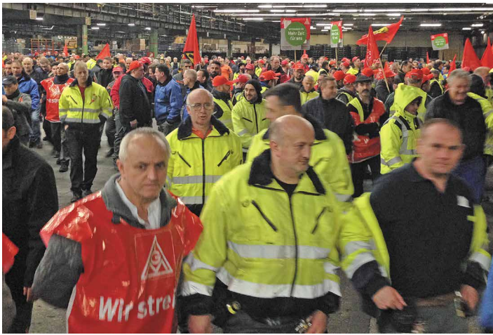
1,2 Millionen Arbeiter in gewerkschaftlichen Tarifkämpfen sind der Ausgangspunkt der kämpferischen Entwicklung (Warnstreik bei Ford Köln)

Bandbreite der Teilnehmerinnen und Teilnehmer – die TAZ formuliert treffend: „Von der Kirche bis zur MLPD“.